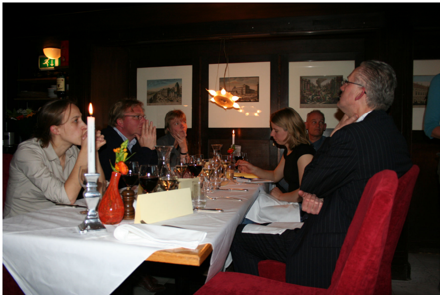
Ambassadeurs en contactpersonen, Werkdiner 11 april