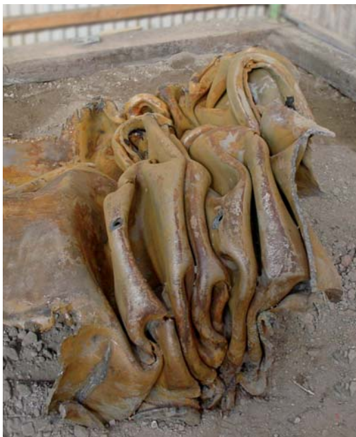
Figuur 4 Voorbeeld uitvoeringsrisico bij heien van een damwand.