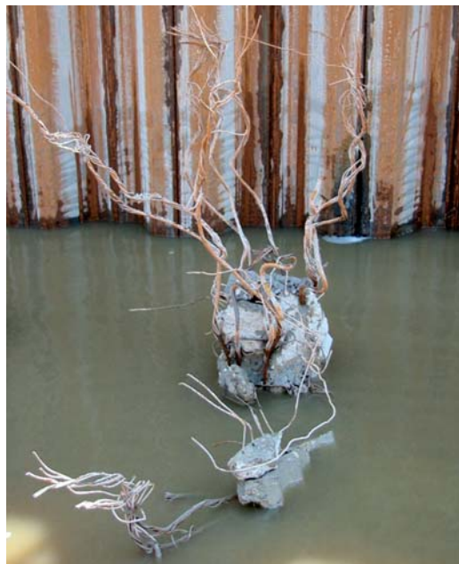
Figuur 5 Voorbeeld uitvoeringsrisico bij heien van een paal.