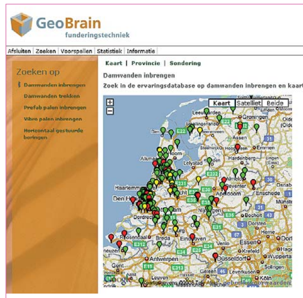
Figuur 3 Via onder andere een kaart kan gezocht worden in de ervarings-database.