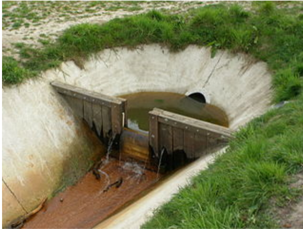
Figuur: Stuw („Titico”, public domain)