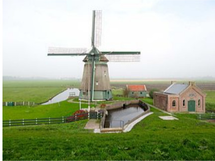
Figuur: Poldergemaal („Gouwenaar”, public domain)