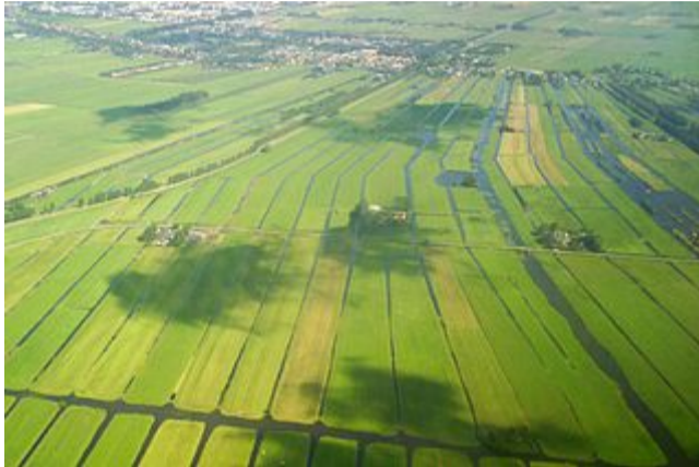
Figuur: Polder (Jan Arkesteijn, public domain)