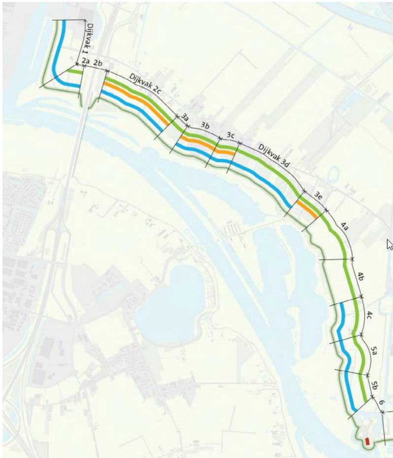
Figuur 1: Veiligheidsopgave CUB aan het eind van verkenningsfase

(GEKB) bij Fort Honswijk, groen betreft de opgave door grasafschuiving van het binnentalud (GABI) en oranje betreft de opgave die veroorzaakt wordt door onvoldoende binnenwaartse macrostabiliteit (STBI). Daarbij moet worden opgemerkt dat, mede op basis van gevoeligheidsanalyses, aan het eind van de verkenningsfase is geconcludeerd dat de opgave nog niet stabiel is. Dit wordt nu in de planuitwerking verder uitgewerkt.