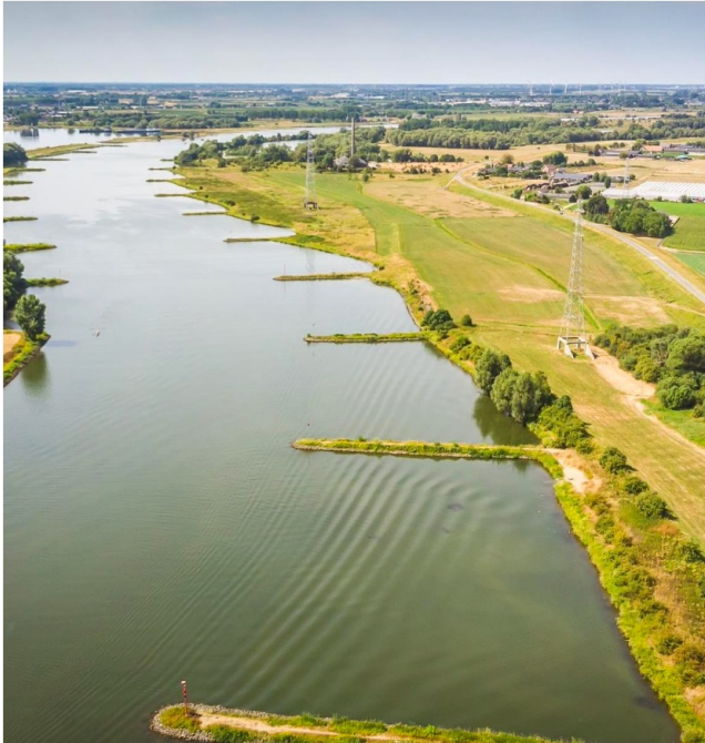
The river Nederrijn in between Wageningen and Rhene, with the Grebbedijk visible on the right