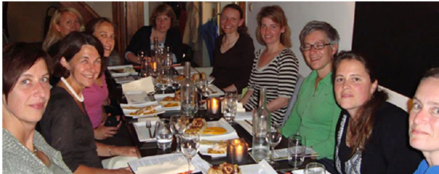
GAIA netwerkdiner in Delft