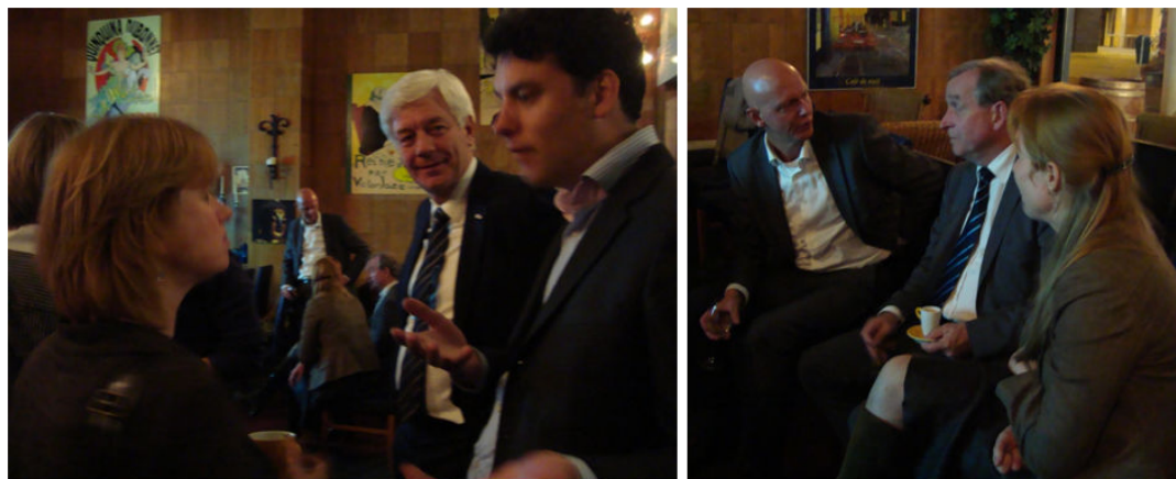
Ambassadeurs, contactpersonen en HR-adviseurs in discussie over wat er is bereikt in "6 jaar GAN" en wat er komende jaren verbeterd kan worden, Bijeenkomst 14 oktober

middenmanagement, dat voor het grootste deel het aannemen en beoordelen van de vrouwen uitvoert. Een verslag van de avond is rondgestuurd naar deelnemers, GAIA-leden en GAN.