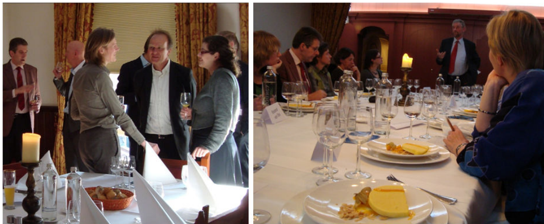
Ambassadeurs, contactpersonen en gespreksbegeleider bespreken hun ervaringen van de gehouden mentor-gesprekken, Bijeenkomst 13 april