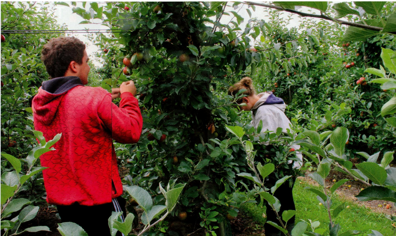
Personeel bezig met vruchtdunning. Ondanks de warme, droge zomer verloopt de teelt probleemloos door de zoetwatertechniek onder de grond